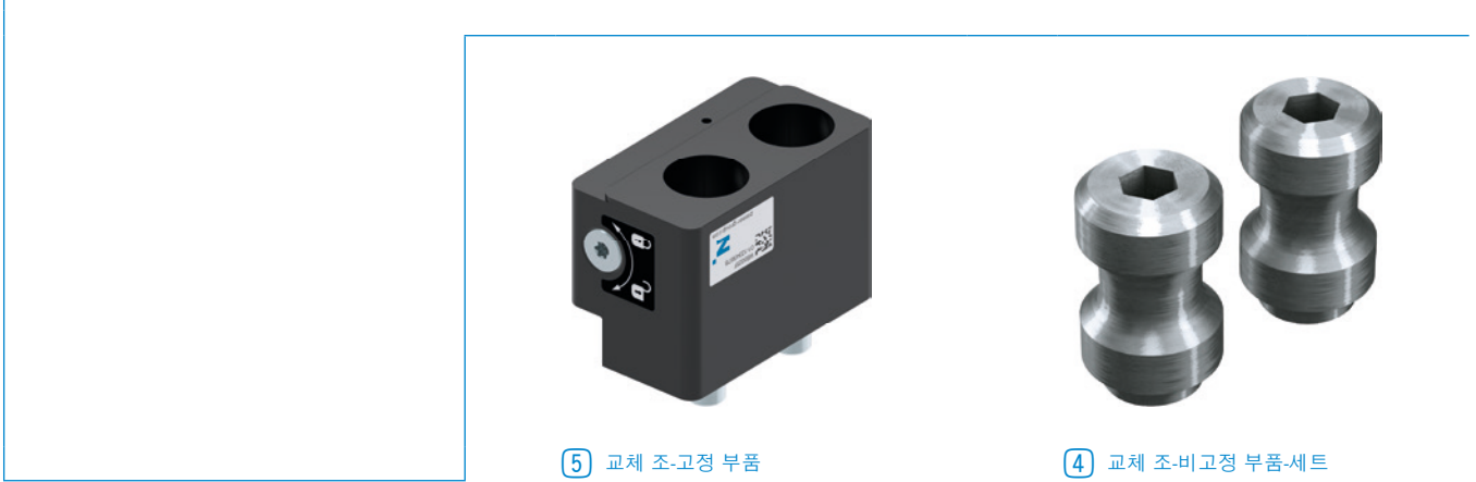
⑤ 교체 조-고정 부품