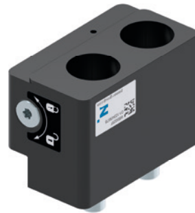
5 Parte fija para cambio rápido de dedos