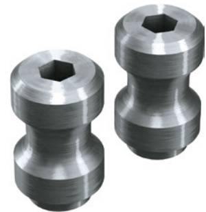
4 Juego de partes sueltas para cambio rápido de dedos