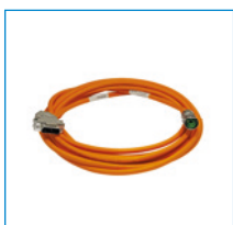
Cables del encoder