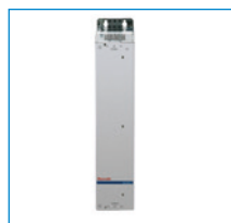
Unidades de mando