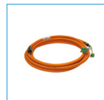
Cables de potencia