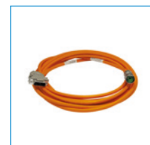
Câbles de signal