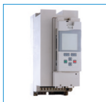
Variateur de fréquence