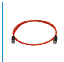
Adaptador para convertidor de frecuencias