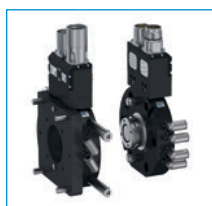
Unité de changement pour robot