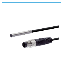
induktívny snímač približenia kábel 0,3 m - zástrčka M8