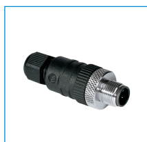
konektor konfekčne použiteľný priame - zástrčka M8