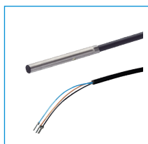
induktívny snímač približenia - kábel 5 m